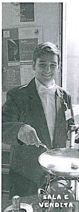
SALA E VENDITA